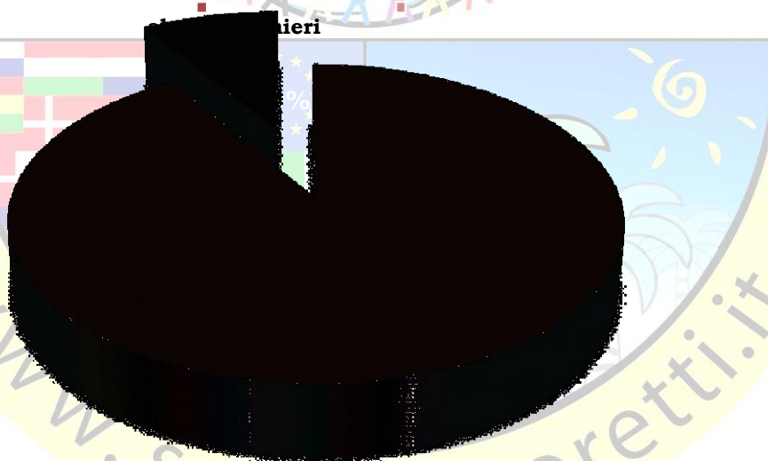
Percentuale alunni italiani e stranieri nel Circolo